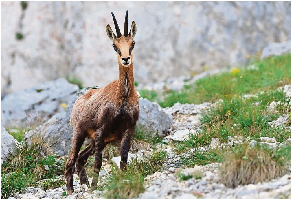
Da schau her: Während Gämsen in allen Alpenstaaten eher vorsichtig bejagt werden, stellt Bayern den Kletterern mehr als nötig nach.

Indes: „Was soll eine Gams in einer Schonung fressen, wo die Bäume zwei Meter hoch sind?“, fragt Schreder. „In solch einem Bestand ist es völlig unerheblich, wie viele Gämsen da einstehen.“ Anders gesagt: Die Gams schadet keinen dieser Bäume! Die Schweizer staunten nicht schlecht, dass das aber eine Fläche der ganzjährigen Bejagung ist. Die Eidgenossen dürfen nämlich nur an genau 17 Tagen jagen – und dann ist Entspannung für die Tiere. In Bayern dagegen ist der Tann nimmer still, zumal zudem noch Wanderer und Mountainbiker die Tiere stören. Präkär wird es dann im Winter. Die Gämsen suchen an den Südhängen, wo es ausapert, Futter. Logisch! Wenn sie dort aber bejagt werden, was sollen sie tun? Was bitte