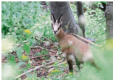
Gämsen leben auch gerne in Wäldern.